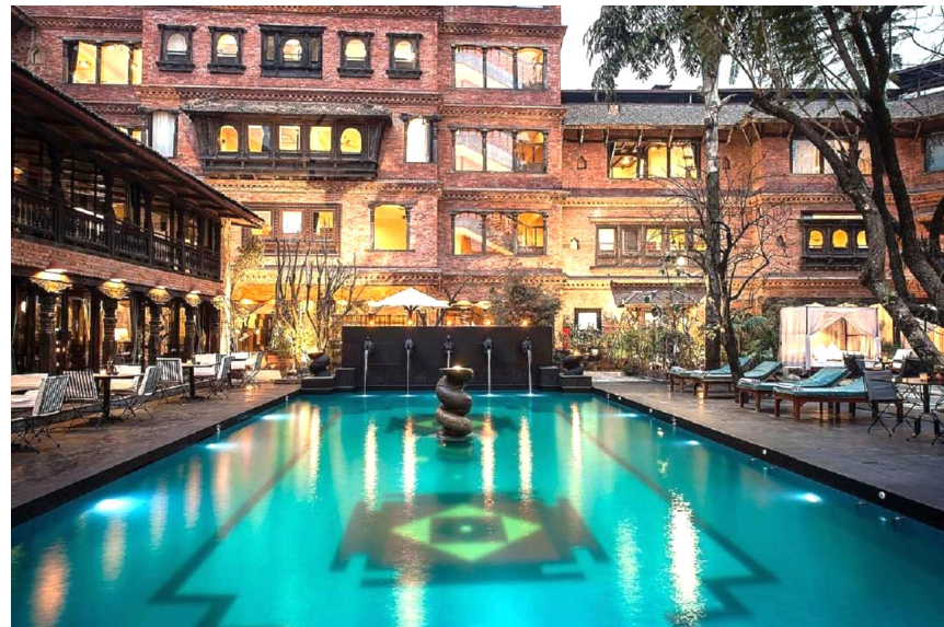
Alojamiento en The Dwarika's Hotel (BB)